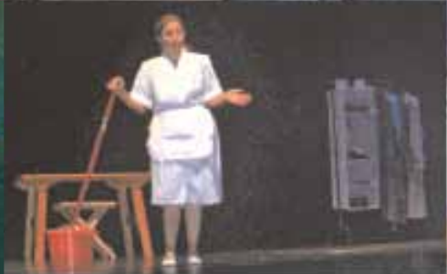
Teatro Scarcha : Los Mandamientos