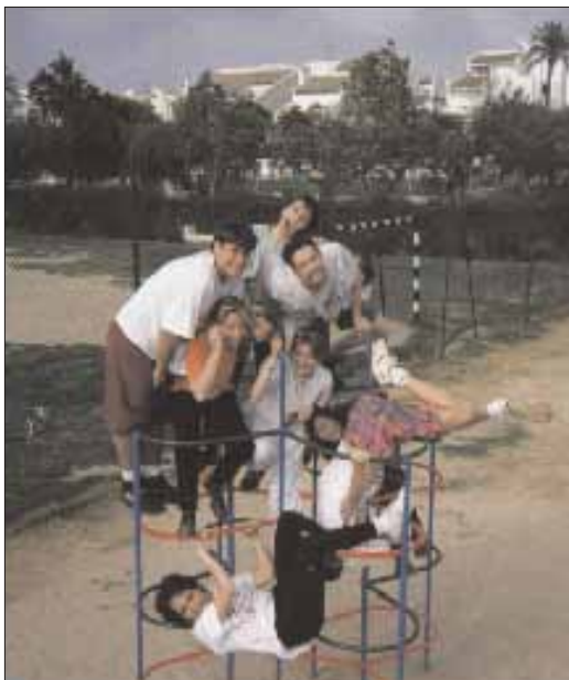
Encuentro de jóvenes en Vilafortuny