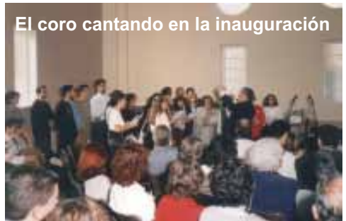
El coro cantando en la inauguración