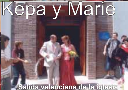
Salida valenciana de la iglesia