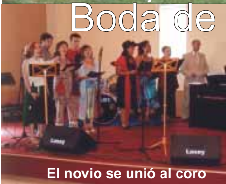
El novio se unió al coro