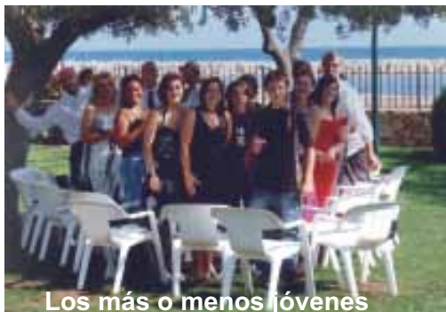
Los más o menos jóvenes