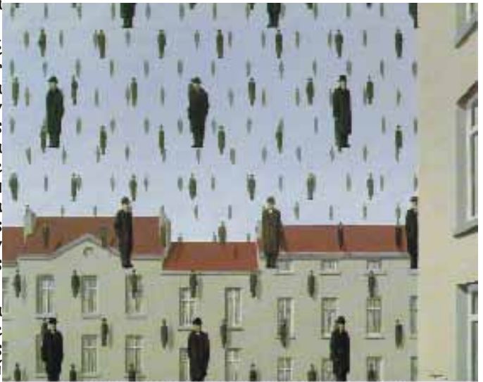
Golconda (René Margritte, 1953)