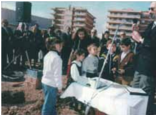
Los niños de la E.D. depositando sus monedas

Don Eduardo inició la ceremonia con unas palabras de presentación, siguió una lectura bíblica por Vicente Navalón. El alcalde dirigió unas palabras a la concurrencia. Tres niños de la congregación española depositaron diversas monedas actuales de España y otros países. Seis miembros de la iglesia, después de pronunciar