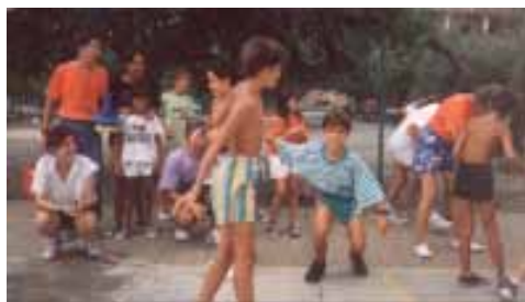
Escala Dei (1991)