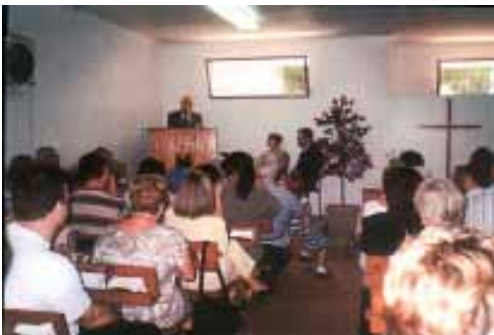
Culto homenaja a los pastores