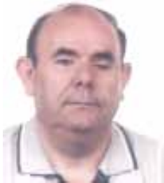
Antoine de Saint-Exupéry