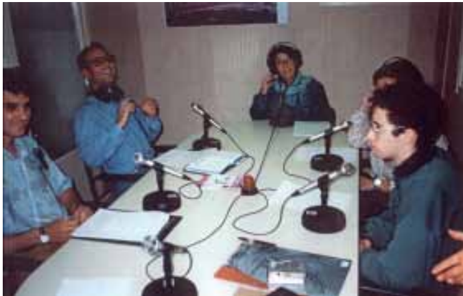
Tarragona Radio: " Puerta a la esperanza "