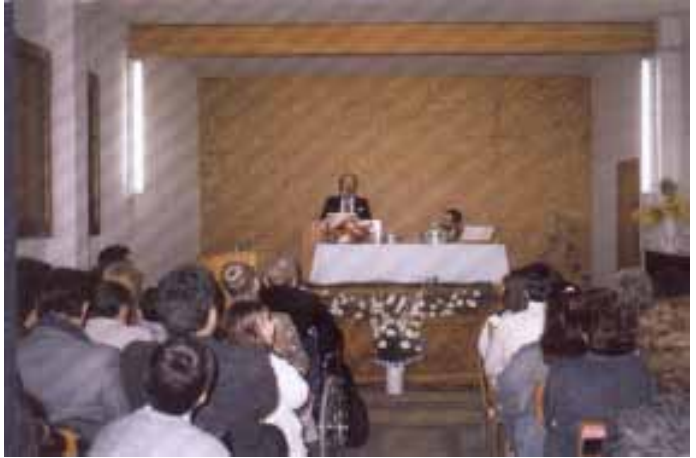
Culto de Bautismos

En distintos momentos, la Misión Holandesa pidió al Pastor se sirviera acoger alguna joven, que deseaban venir a España para trabajar y colaborar en las actividades de la iglesia. En general su estancia fue corta. Quien estuvo más