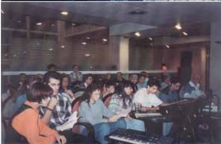
Retiro de jóvenes en el Hotel Estival Park I de la Pineda de Salou