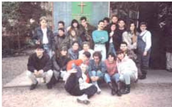
Grupo de jóvenes (Aprox. 1990)

Es un buen teólogo y buen conocedor de la música. Después de una extensa conversación con el Pastor, y obtenida su aquiescencia, traslada su residencia de Lérida a Cambrils, y busca trabajo en al zona como profesor de inglés, que lo consigue en Cambrils. Fue y es un buen elemento, se cuida de la parte musical de los cultos con su guitarra, toma la responsabilidad e instrucción en la Escuela Dominical entre los niños mayores, y posteriormente las reuniones de los adolescentes. Predica y da alguna conferencia; es buen enseñador y predicador. Después de no mucho tiempo, la iglesia viendo su amor al Señor y a su pueblo y los dones que el Señor le había dado, no tardó mucho en que fuera reconocido como anciano de la iglesia, y que sigue hasta el día de hoy como tal en el consejo de iglesia. Buen creyente y temeroso de Dios. Persona de fe y consagrada. Es un joven de quien se puede tomar ejemplo, a pesar de sus peculiaridades. Hace trabajos humildes que no le conciernen, pero necesarios para la iglesia, y sin esperar a que alguien le pida. Tiene muy buena aceptación entre los jóvenes, sabe conectar con ellos.