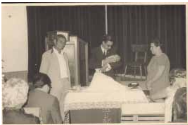
Presentación de una niña en Sevilla (28-3-1969)

Su vocación se inició ya cuando niño: a los 9 años se entregó al Señor en su ciudad natal de Londres, y fue la pesadilla de su Pastor pidiéndole el bautismo, hasta que lo consiguió. Cuando niño fue el más pequeño de su grupo y fue muy pacífico. Sus aficiones fueron de siempre: la lectura, la música (tocaba el violín) y las colecciones de sellos; aficiones que posteriormente no pudo continuar por falta de tiempo con sus múltiples actividades; reservando y centrando su tiempo libre a la oración, la lectura, la escritura, el estudio y la meditación. En su juventud cursó los estudios de escolaridad, y trabajó como censor de cuentas en una empresa de Londres.