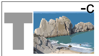
Lugar en donde Pablo predicó