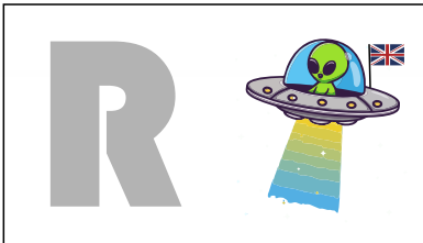
Hijo de Simón