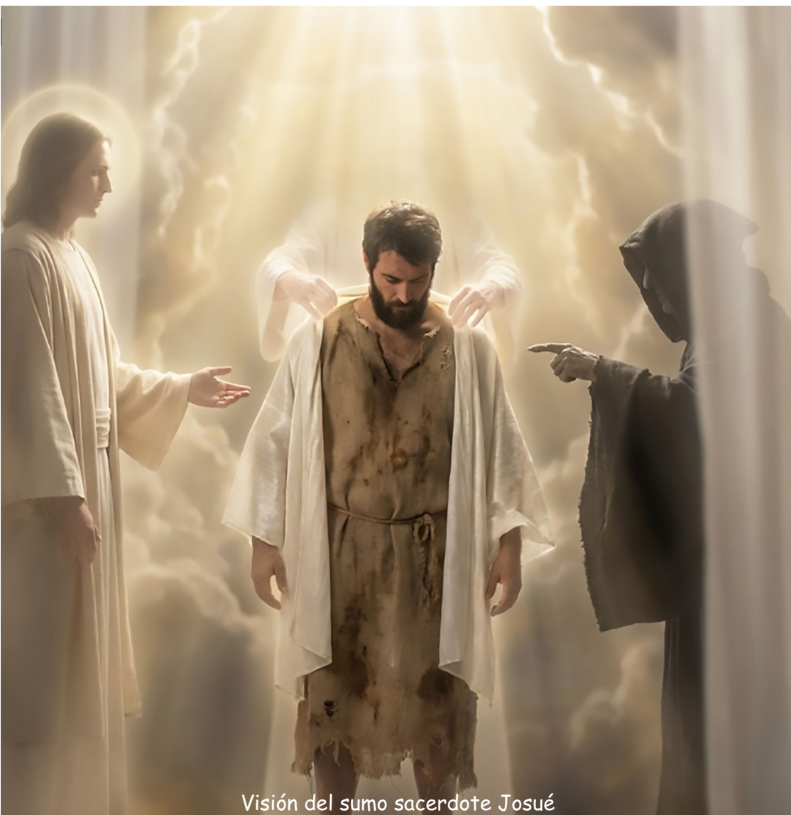
Visión del sumo sacerdote Josué

3 Me mostró al sumo sacerdote Josué, el cual estaba delante del ángel de Jehová, y Satanás estaba a su mano derecha para acusarle. 2 Y dijo Jehová a Satanás: Jehová te reprenda, oh Satanás; Jehová que ha escogido a Jerusalén te reprenda. ¿No es este un tizón arrebatado del incendio? 3 Y Josué estaba vestido de vestiduras viles, y estaba delante del ángel. 4 Y habló el ángel, y mandó a los que estaban delante de él, diciendo: Quitadle esas vestiduras viles. Y a él le dijo: Mira que he quitado de ti tu pecado, y te he hecho vestir de ropas de gala. 5 Después dijo: Pongan mitra limpia sobre su cabeza. Y pusieron una mitra limpia sobre su cabeza, y le vistieron las ropas. Y el ángel de Jehová estaba en pie.