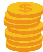
AMOR AL DINERO