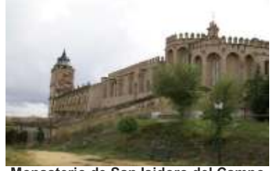
Monasterio de San Isidoro del Campo

La estatua, obra del afamado escultor Estanislao García Olivares, se elevará 3,15 metros del suelo, sobre una base de granito. La figura tallada en bronce de Casiodoro de Reina lleva una Biblia abierta en sus manos. En la base de piedra, se colocará una placa con la siguiente leyenda: "A Casiodoro de Reina y los traductores de la Biblia al castellano. Por la libertad y la tolerancia".