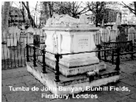
Tumba de John Bunyan, Bunhill Fields, Finsbury, Londres

Se trata de un viaje desde este mundo hasta el mundo venidero