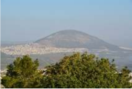
El Monte Tabor.

¿Es este monte Tabor el de la Transfiguración de Jesús? (Mt. 17:1-9).