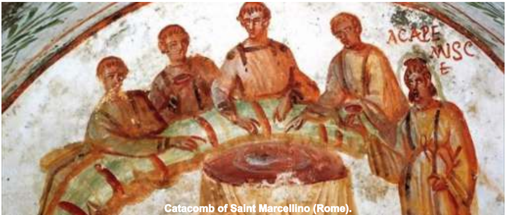
Catacomb of Saint Marcellino (Rome).

¿Quieres ver los anteriores boletines, utilizar un diccionario bíblico , ver sketchs , ver predicaciones anteriores, escuchar Radio "Bona Nova" , descargar epubs , biblias , Radio Esparraguera y muchas cosas más? Ve a la página: http://www.multimediaarxe.com/Bolet-Vilan/index.html