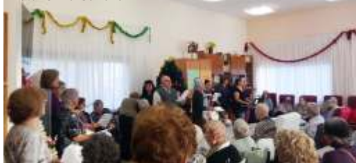
El día 2 un buen grupo de Vilanova fue a cantar villancicos a la residencia de Reus