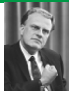
Billy Graham, en abril de 1966

Apodado como el "pastor de Estados Unidos en la segunda mitad del Siglo XX", predicó el evangelio cara a cara a más personas que ningún otro hombre en la historia: casi tres millones y medio de almas decidieron aceptar a Cristo como Salvador personal en respuesta a sus invitaciones hechas a lo largo de sus numerosas campañas de evangelización.