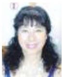
Compilado por Mercè Huete

El Señor sabe cómo somos cada uno de nosotros. Nos ha escogido tal y como somos. El Señor es fiel incluso cuando nosotros no lo somos. Nada puede separarnos de su amor. Confía en Él.