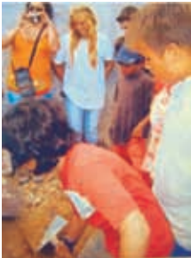
Entierro de la Cápsula en 2009

Hoy termina la X acampada. Acordaros de recoger todo lo de vuestros hijos.