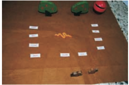
Historia del Edén perdido.