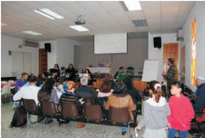
Dos momentos de la reunión

Dios es luz. La Palabra de Dios nos ilumina. De manera especial la luz de la presencia de Jesús resplandece con más intensidad en las vidas transformadas de aquellos que le conocen