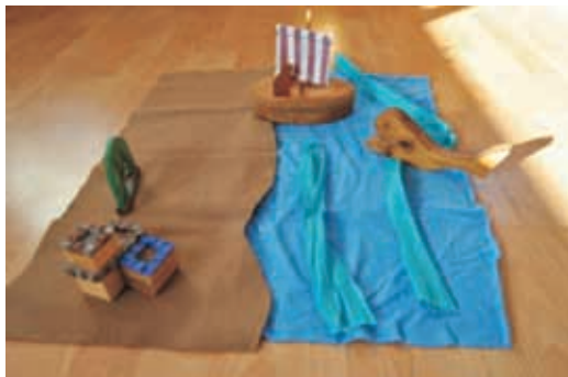
Historia de Jonás (iglesia)

Los maestros/as de la iglesia de Salou comenzamos a desarrollar este método en el año 2006, montamos una sala modelo en varios lugares de la iglesia, hasta tener la que ocupamos actualmente en el piso superior (considerada una de las salas Modelo Nacionales), durante 4 años varias personas se fueron formando en el método, actualmente tenemos muchas personas que desean conocer más y formarse .