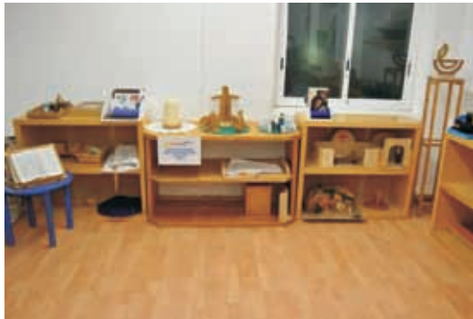
Sala modelo de la Iglesia Protestante de Salou.