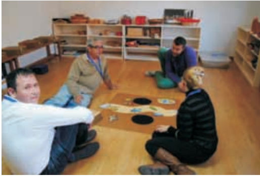
Parábola del Buen Samaritano