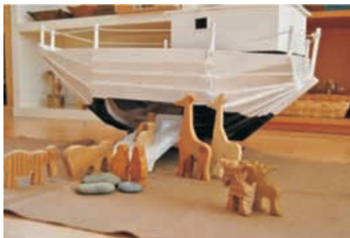
Historia del Arca de Noé(iglesia)